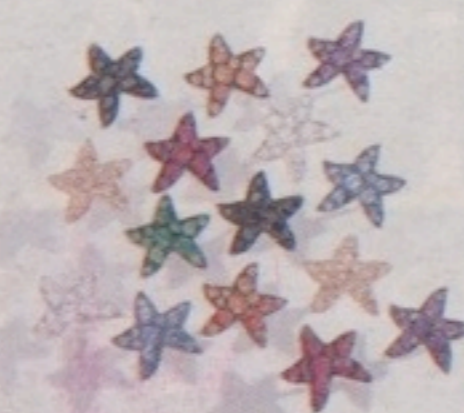
I nuovi anelli M'ama Non M'ama di Pomellato e sopra i ciondoli a forma di stella di Dodo (circa 300 euro)