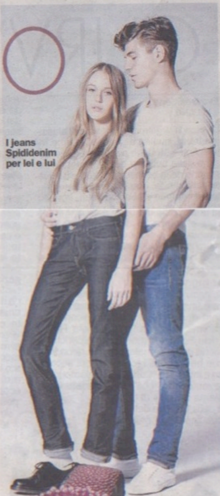
I jeans Spiddidnim per lei e lui